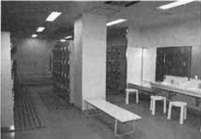
男女別に250人が利用できるコインロッカー