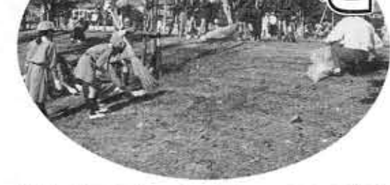
植樹前に清掃するボーイスカウト・ガールスカウトのみなさん