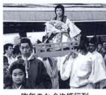
昨年のかぐや姫行列

お勤めの看護婦さん。「ダメでもともとと思って応募したので、自分が抽選に当たるとは思っていませんでした。でも、平安建都1200年の記念すべき年のかぐや姫に選ばれてよかったと思います。」と、当選の喜びの声を聞かせてくださいました。