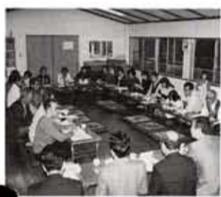
昨年度のさわやか対談

市では、地球環境保全の観点から、家庭で不用になった冷蔵庫を対象に4月から「フロンガス」の回収を行います。フロンガスが大気中に放出されるとオゾン層を破壊し、地上に到達する有害な紫外線が増加して、人の健康や自然に悪影響を及ぼします。フロンを回収するためには、消費者、事業者（製造・販売業者）、廃棄物の処理者などの協力が不可欠です。フロン使用製品の円滑な回収に、市民のおみなさんご協力をお願いします。 ◎廃冷蔵庫の回収申込 電話で予約してください。回収は、個別回収方式で有料（廃棄物処理手数料）となります。お問い合わせは環境対策課（内線227）へ。