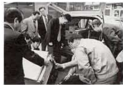
フロン回収装置の説明を受ける関係者

市では、地球環境保全の観点から、家庭で不用になった冷蔵庫を対象に4月から「フロンガス」の回収を行います。フロンガスが大気中に放出されるとオゾン層を破壊し、地上に到達する有害な紫外線が増加して、人の健康や自然に悪影響を及ぼします。フロンを回収するためには、消費者、事業者（製造・販売業者）、廃棄物の処理者などの協力が不可欠です。フロン使用製品の円滑な回収に、市民のおみなさんご協力をお願いします。 ◎廃冷蔵庫の回収申込 電話で予約してください。回収は、個別回収方式で有料（廃棄物処理手数料）となります。お問い合わせは環境対策課（内線227）へ。