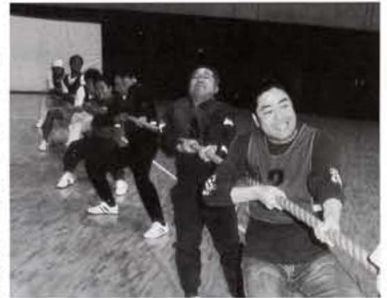
迫力満点の綱引き競技(市民体育館)