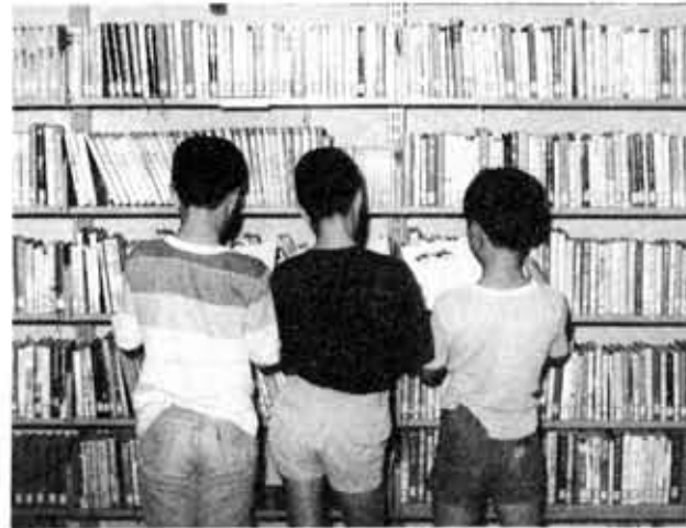
読書の秋、あなたもこの秋一度ご利用ください

秋の夜に読書はいかがかと、中央公民館では十月十八日から十二月二十日まで二カ月間、市内二カ所（寺戸町永田集会所、上植野町農家組合集会所）で「移動文庫」を試験的に開設します。 現在、中央公民館図書室では、市民のみならずの約四・七パーセントにしかすぎません。 図書室では、もっと多くの方が利用されるようにと昭和五十三年度から「地域児童文庫」への図書貸出し制度、また新着図書を紹介など、図書普及のPRに努めてきました。 今回の移動文庫もその一つで、読書普及と図書利用の便宜を図ることを目的とし、また将来の「巡回文庫」への基礎調査として行われるものです。 移動文庫の内容は次のとおりです。どうぞご利用ください。