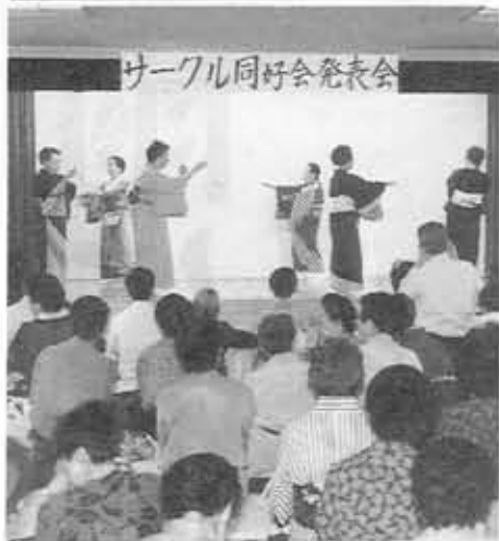
サークル同好会発表会