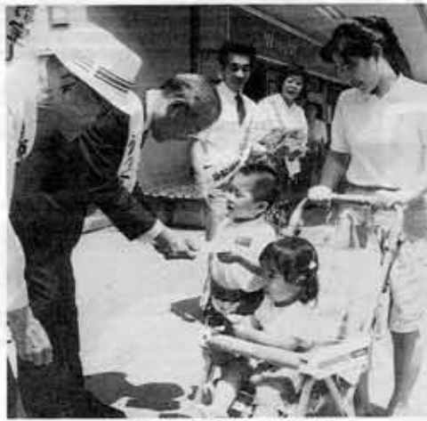
環境保全街頭啓発(昨年)

8日(金) 不法投棄防止の啓発と、市内一円で不法投棄物の回収を行います。 急東向日駅前・柳ニチ向日町店前で、1000セットの花の鉢を配布します。 7日(木) 午前11時から、民秋市長をはじめ環境月間プロジェクトチームが、阪