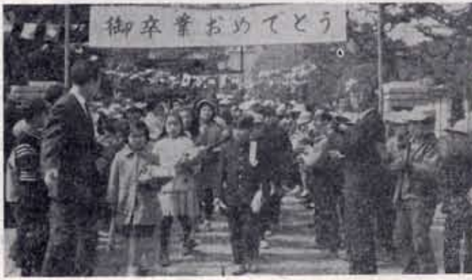
この写真に写っている卒業生に写真を添え上げます。(総務課広報係)

くらしの環境づくり 石田川の四ヶ年改修 京都市の田園住宅都市として、急速に発展する町を、住みやすく、美しい環境にしたい。