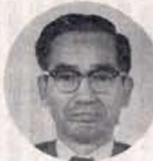
写真左から右へ、氏名が不明な町議会議員の一人。

四十年度予算を審議した第一回町議会臨時会は、三月十九日から二十一日までの会期で、投機会議を開いた。