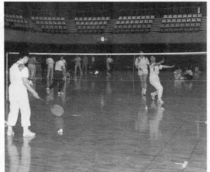
市民体育館でスポーツを楽しむ市民のみなさん