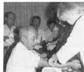
検査の結果、高脂血症と高血圧症の要治療と要指導(境界域)を合わせると、昨年度と同様40%を超える高い割合となっております。また、肥満なども増加傾向にあると注目を呼びかけています。