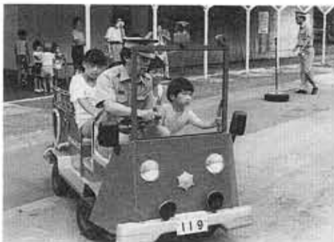
子供たち人気のミニ消防車も登場(昨年)