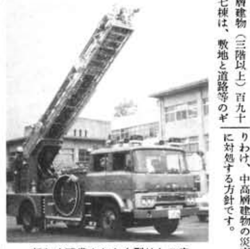
新しく配備された大型はしご車

市消防本部が、本年度の消防力の整備計画にあげていた「はしご付消防ポンプ自動車」が、先月下旬完成し、十二月一日から出動配備につきます。 今回配備された「はしご車」は、二十四・四メートルの高さまで接岸できる大型で、このクラスのはしご車は、京都市を除く府下の市町村では初めてです。 市では、建物の高さを二十メートルまでに制限しているため、市内にある中高