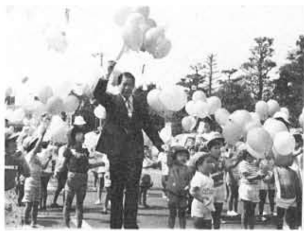
風船を大空に放つ市長と園児たち

六月五日から一週間は「環境週間」でした。市で育所園児五十人をはじめ、空きカン一掃チームの職員など百二十人が集合。一般