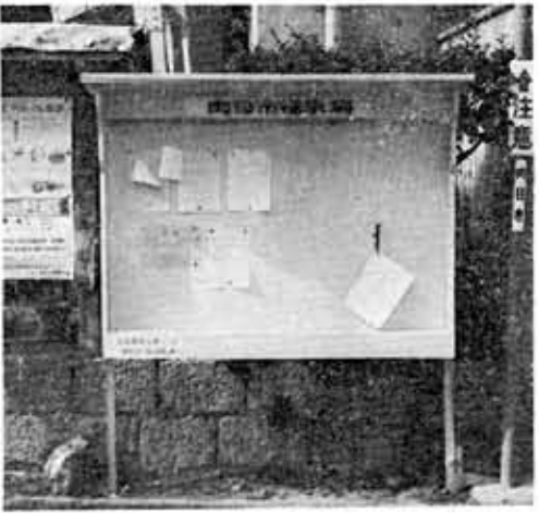
新しく衣がえした揭示場

◆あなたは市の揭示場をご存知ですか。このたび、……◆ ◆より多くの市民のみなさんに揭示場を知って……◆ ◆……だくため、みなさん方の目にとまりやすい場所を……◆ ◆……選り、新しく衣がえしました。揭示場は市内十二……◆ ◆……箇所があり、市政の重要事項などを揭示して……◆ ◆……す。市政の知識はまず揭示場です。◆ 過密化する地域によって、重要なこととして、行政と住民のつながりはと、そのためには、広報板とともに揭示場を設けて、そのP・Rに努めています。 市民に行政の行う事項、行っている事項をよく知ってもらい、よく理解してもらい、行政の基本