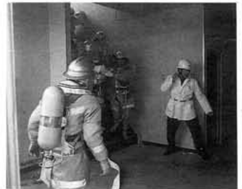
■大規模消防訓練■低出火を誇る向日市消防が、煙の中での救助・消防訓練を実施(郵便局仮庁舎)