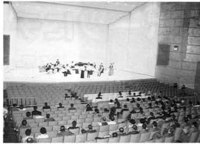
京都府長岡京記念文化会館の開館を祝い公演する京都フィル

長岡京遷都1200年を記念して、長岡京市天神に京都府が建設を進めていた、「京都府長岡京記念文化会館」が5月6日オープンしました。 会館は、乙訓2市1町住民の文化活動や交流の場として、建設されたものです。