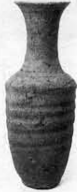
長岡京の土器を代表する黒二合徳久利

4月に設立された向日市埋蔵文化財センターは、向日市文化資料館と共催で、6月5日まで特別展示会「長岡京人の食器とその流通」を文化資料館で開催しています。 出土した土器を通して、1200年前の役人や庶民の暮らしぶりを理解できる展示です。