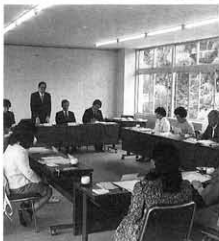
市政モニター発会式であいさつする民秋市長