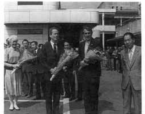
■サラトガ市長表敬訪問■ピターソン市長夫妻・モイルス前市長が訪問され、友好を確認。