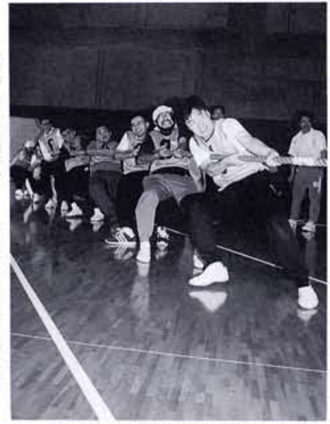
カ一杯綱を引く参加者(物集女子チーム)