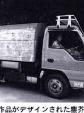
市民応募の作品がデザインされた塵芥車

本年度も、「じんかい君」の「塗装デザインコンテスト」を実施します。 ●応募のきまり 応募は向日市民なら誰でもできます(友人同士の合作も可)。応募作品は、これからの時代にふさわしい「ごみ収集車」のデザイン(塗装部分)を表したもので、色彩は自由ですが、大きさはおおよね縦1、横3の割合になるよう描いてください。作品は未発表の自作のものに限られ、1人1点(合作の場合1グループ1点)です。