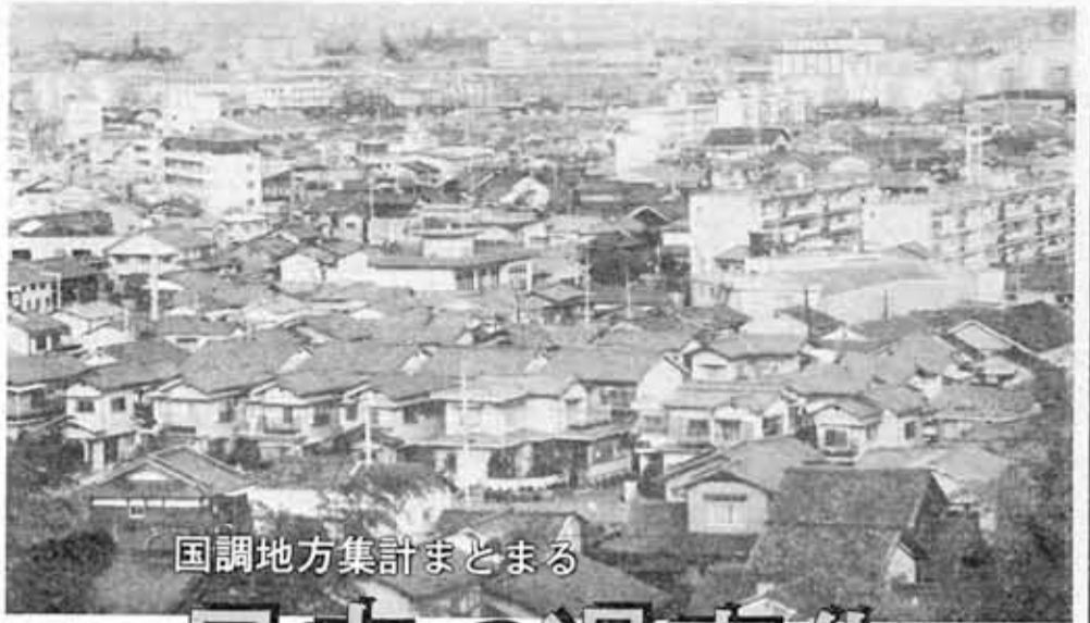
国調地方集計まとまる