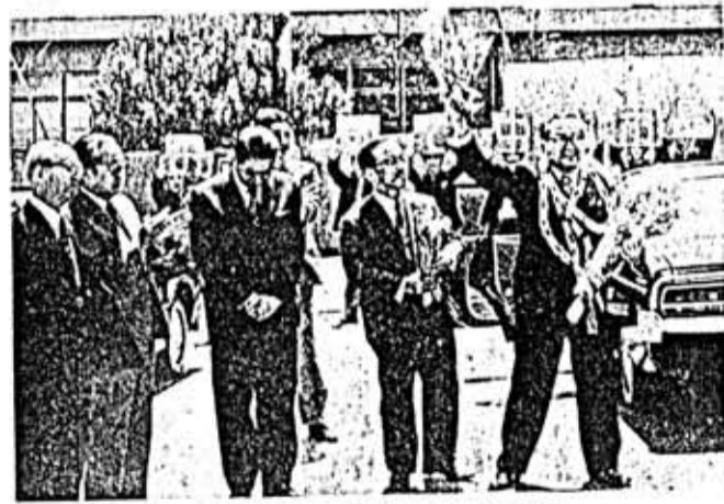
(ご苦労さま、お元気で中山市長)