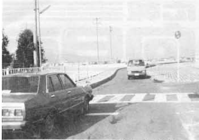
道路拡幅で一方通行も解消

入所申請書の受付は、1月21日(月)から2月9日(土)まで、教育委員会社会教育課でお渡しします。 ただし、現在入所されている児童については、各留守家庭児童会でお渡しします。 ◎入所受付説明会 ▼日時 2月2日(土) 午後2時～4時 ▼場所 市民会館第1会議室 ◎入所受付 ▼日時 2月4日(月)～9日(土) 午前8時30分～午後5時(ただし、土曜日は午後3時まで) ▼場所 教育委員会社会教育課 市内の小学校に在学する児童のうち、保護者の共働き等の理由により、放課後家庭において保育指導ができない低学年の児童(1年生～4年生)を対象とします。 お問い合わせ 教育委員会社会教育課 (電話 931-1111)