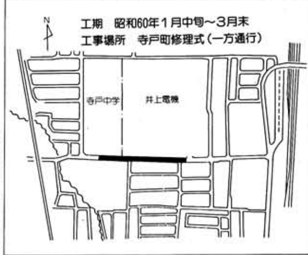
工期 昭和60年1月中旬～3月末 工事場所 寺戸町修理式(一方通行)

水道部では、有収率の向上をはかるため、市内全域の水道管について漏水調査を行います。 調査は、おもに使用水および交通量の少ない夜間に行います。大変ご迷惑をおかけしますがよろしくお願いたします。 調査員は、腕章・調査器具を身につけ、道路の水道管を調査します。 なお、調査期間中は、断水などの工事は行いません。 ◆調査期間 1月21日(月)から28日(月)まで