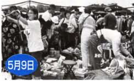
フリーマーケット開催