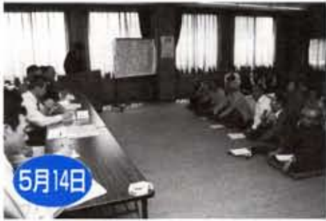
高齢者がホソネで語る交行政

ごみの減量やリサイクルに対する関心を高めてもらおうと、リサイクルひまわり市が開催されました。掘り出し物を求める市民らが続々と詰めかけ、約5,000人の人で賑わいました。