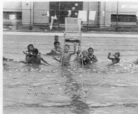
子供水泳カーニバル 水中玉入れ・ビーチボールバレー・ゴルフボール探しに大歓声。