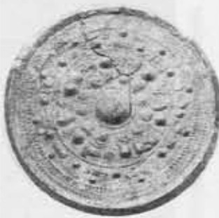
三角縁神獸鏡(妙見山古墳)