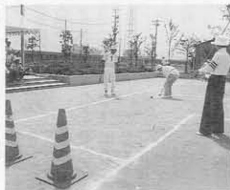
高年齢交通安全ゲートボール大会 ゲームを楽しみながら交通规则を学ぶ老人クラブのみなさん