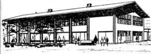
第4向陽小体育館の完成予想

校の体育館建設がまきり、さる八月二十日から工事が始まっており、来年二月二十日には完成する予定です。 向陽小学校の給食室は、昭和二十四年に建設された