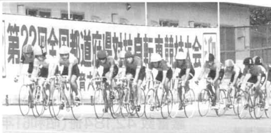
スリル・スピード 熱い戦いが展開された向日町競輪場