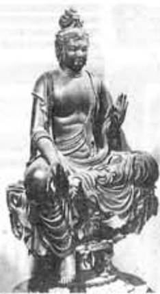
宝善提院(寺戸町西野)の前身は、7世紀創建の市内最古の大寺院でしたが、今は、国宝の仏像とともに京都市西京区大原野の勝持寺に移っています。