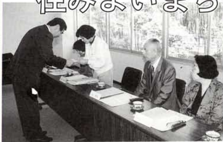
岡崎市長から委嘱状を受け取る市政モニターのみなさん

4月22日(月)市役所大会議室で、第9期向日市政モニター発会式が行われ、新たに12人の市政モニターが誕生しました。岡崎市長から委嘱状を