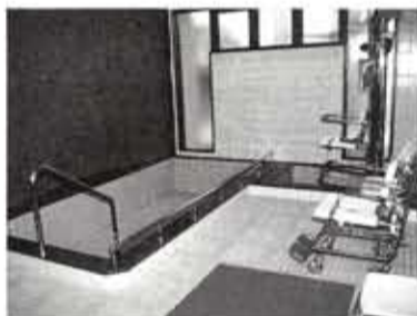
福祉会館のリフト付き介護浴室

家庭内で入浴が困難な重度身体障害者で、家族が送迎および介助できる人を対象に入浴サービスを開始します。毎週水曜日の午後3時から4時30分まで、福祉会館の介護浴室で、1日2組まで利用できます。料金は無料。