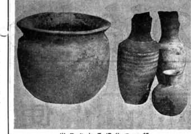
出品される遺物の一部 土師器の甕と須恵器の壺(鶏冠井町十相出土)

市教育委員会は、昭和五十二年の長岡京発掘調査による出土遺物を中心とした展示会と、旧石器時代から奈良時代までの歴史講演会を、次のおり開催いたします。ぜひ、ご来場下さい。 〔日時〕三月二十四日(金)・二十五日(土)・二十六日(日) 午前九時～午後五時 〔場所〕市民会館第一会議室