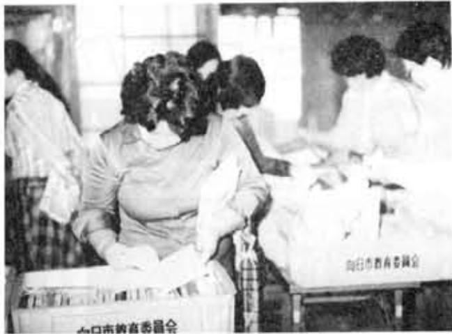
にぎわう移動文庫 (上植野町御旅所)

より多くの人に図書の利用をしていただくこと、十月十八日、寺戸町水田集会所で「移動文庫」がスタートしました。 これは、読書の普及と図書利用の便宜を図り、将来の「巡回文庫」への基礎調査として行われるものです。 この日、天気はあいにくの雨でしたが、近所の主婦の方などが多数訪れ、読みたい本を選んでいました。利用者には「これで便利になる」と好評で、貸出ししたのは、成人用十六冊・児童用十八冊の合わせて三十四冊でした。