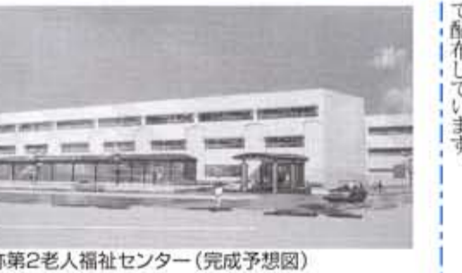
仮称第2老人福祉センター(完成予想図)

6 上植野町南開66-1老人福祉センター(仮称) ☎934-1515 ☎935-1808