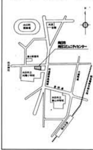
向日コミュニティセンター位置図

同コミュニティセンターは、寺戸、西向日に続いて3番目のもので、地域住民の皆さんの自治会活動をはじめ、地域のコミュニティ活動・社会教育の実践の場として建設しました。 同コミュニティセンターは、鉄骨造り2階建てで延床面積は約200平方メートル、敷地面積は、約500平方メートルです。 1階には、自治会の集いやサークル活動などができるレクリエーションルームと事務室を、2階には、茶道、生け花などの各種教室として利用できる和室2部屋と、料理実習や少人数での会議もできる実習室を設けています。 利用方法は、次のとおりです。 ▽開館時間 午前9時から午後9時30分まで ▽休館日 毎週月曜日及び祝日(1月2日から1月4日まで、12月28日から12月31日まで) ▽使用の手続 使用日の2日前から前日までに使用の申込みをしてください。申込みには、印鑑が必要で、