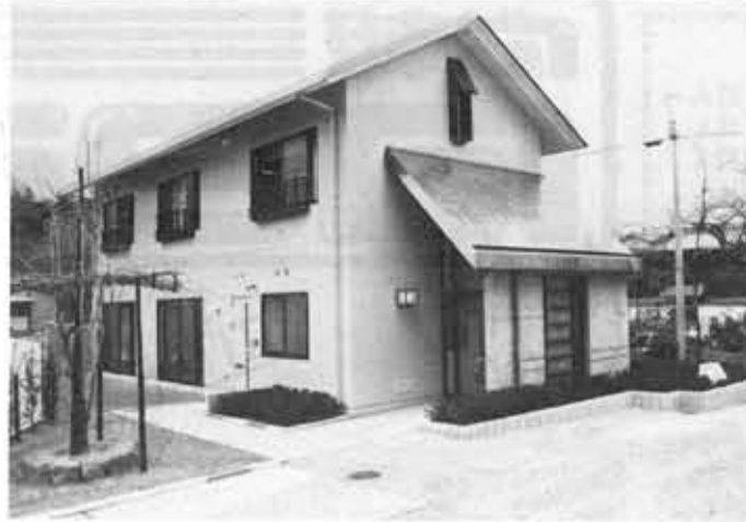
向日コミュニティセンター

地域活動の拠点として、また子供からお年寄りに至るまで幅広い住民活動の場として広く利用していただけます。