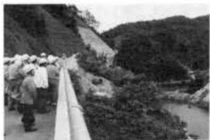
日吉ダム建設現場を見学する参加者(昨年)