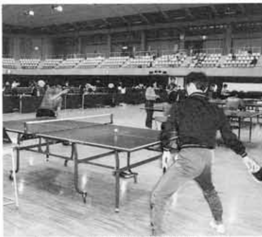
約1ヵ月にわたり熱戦が繰り広げられます。

市民参加のスポーツ大会として広く親しまれている第13回向日市民総合体育大会が、いよいよ開幕します。5月15日(日)午前9時30分から市民体育館で行われる総合開会式をかわきりに、約1ヵ月にわたる11種目の競技が繰り広げられます。奮ってご参加ください。 ■男子バレーボール 日時 5月15日(日)午前10時30分 会場 市民体育館 種別 団体戦(9人制) ■ゲートボール