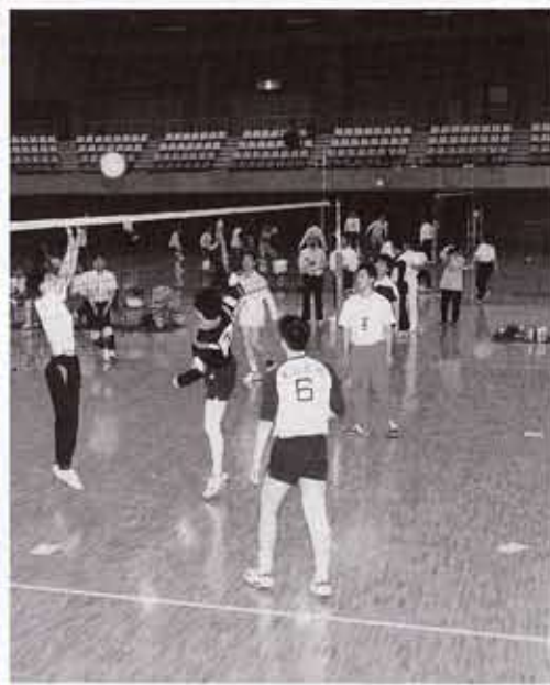
約1か月にわたり熱戦がくりひろげられます

市民参加のスポーツ大会として広く親しまれている第14回向日市民総合体育大会が5月21日(日)からソフトボール・テニス大会をかきわきりに、約2か月にわたり11種目の競技が繰り広げられます。なお、総合開会式は5月28日(日)午前9時30分から市民体育館で行われます。奮ってご参加ください。 ◎ソフトボール 5月21日(日)6月11日(日)午前8時30分から洛西浄化センターで。種目は団体戦男女、参加費1チーム2000円。申込締切4月30日。 ◎ボウリング 6月4日(日)午前9時から嵯峨ニッケボールで。種目は団体戦男子4・女子4、個人戦は団体戦の個人成績により決定。参加費1チーム4000円。締切5月28日(日)。 ◎バドミントン 6月11日(日)午前9時20分から市民体育館で。種目は団体戦男子・女子・混合ダブルス、個人戦男子・女子ダブルスA・B・C級。参加費1チーム1200円。申込締切6月25日(日)。 ◎ソフトテニス 6月18日(日)午前9時から市民体育館で。種目は個人戦男子・女ダブルスA・B・C級。参加費1組4000円。申込締切6月30日(日)。 ◎ゲートボール 6月18日(日)午前9時30分から市民ふれあい広場で。団体戦各地区3チーム以内。参加費1チーム1000円。申込締切6月2日(日)。 ◎女子バレーボール 6月25日(日)午前9時から市民体育館で。種目は団体戦9人制。参加費1チーム2000円。申込締切6月10日(日)。 ◎卓球 7月2日(日)午前9時から市民体育館で。種目団体戦男子単2・女子単2・男女混合複1、個人戦一般・40歳以上・50歳以上。参加費団体1チーム1200円、個人1人2000円。申込締切6月18日(日)。 ◎綱引き 7月2日(日)午後3時から市民体育館で。種目は団体戦男子8名、合計体重560kg以内。参加費1チーム1600円。申込締切6月25日(日)。 ●申込は、所定の申込用紙で向日市体育協会☎92212211へ。団体種目(ソフトボールを除く)については各地区体育振興会のうえ申し込む。申し込み用紙は向日市体育協会・各地区体育振興会にあります。