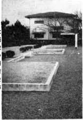
大極殿の南階段跡

造営工事が早く進んだ要素がもう一つあった。それは新しく木を伐り、瓦を焼いては時間が