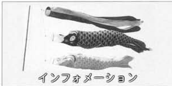
インフォメーション