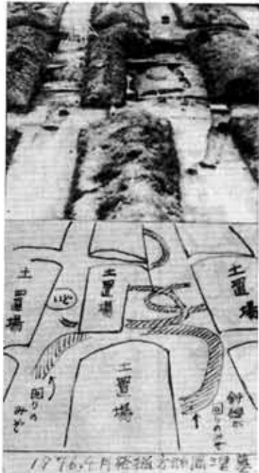
昭和51年4月に発掘された寺戸町岸ノ下の方形周濠墓

は例を見ない変わった形の大古墳があり、その出現もまことに突発的だ。大和朝廷の出現と、