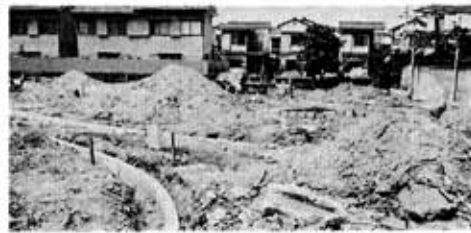
（深田川児童公園用地を整備）

第二回定例町議会が、六月十四日から七月十日までの会期中に開かれました。この議会で、一般会計補正予算案が可決されました。補正額は、千七百七十七万円で、歳入歳出の予算現額は、十四億五千八百三十三万とになりました。おもな補正予算のうちわけは、つぎのとおりです（単位万円）。