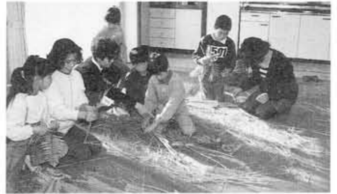
■正月のしめかざりづくり■物集女コミセンでワラ細工教室が開かれ、親子で正月のしめかざりを作りました。