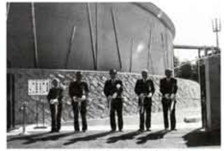
岡崎市長らによるテープカット

「21世紀に向けた災害にも強いゆとりある水道」の構築を目指し平成8年度から建設を進めていた物集女新配水池がこのほど完成し、3月23日に竣工式が行われました。府営水道の受水池も兼ねたこの新配水池は、災害に強くマグニチュード8規模の地震にも耐える円筒形2重構造で直径46・7メートル、高さ6・35メートル、貯水容量は、1万立方メートルで、内部は5千立方メートルづつの内池と外池に分かれています。また、設定震度以上で自動的に配水を停止し、配水池の水を守る「緊急遮断弁」や、給水タンク車が横付けできる「緊急時応急給水施設」を備えており、緊急時の応急給水施設としても利用できます。