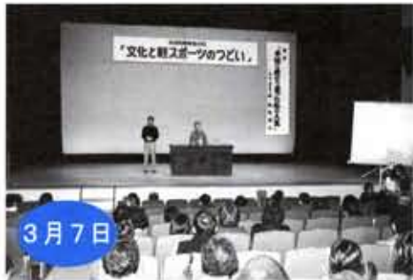
向日市障害者の日

西向日自治会への防災備蓄倉庫の引き渡し式が行われました。式では、西向日自主防災会による放水訓練が披露されました。会員達は、きびきびした動作で日頃の練習の成果を発揮しました。