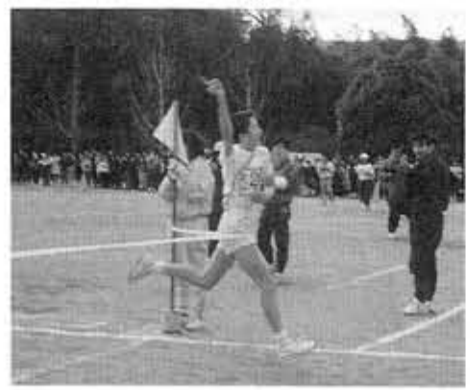
■第二向陽小、駅伝大会で見事優勝■ 「第2回乙訓地方小学生駅伝大会」(18小学校参加)で第二向陽小学校が優勝。冬休みからの練習の成果を十二分に発揮しました