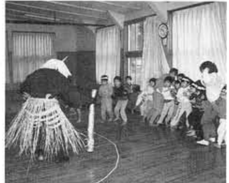
■第一保育所「節分のつどい」■ 突然の赤鬼、青鬼の登場に泣き出す園児も。でも勇気を出した園児たちの力強く投げつける豆に鬼たちは間もなく逃げていきました。