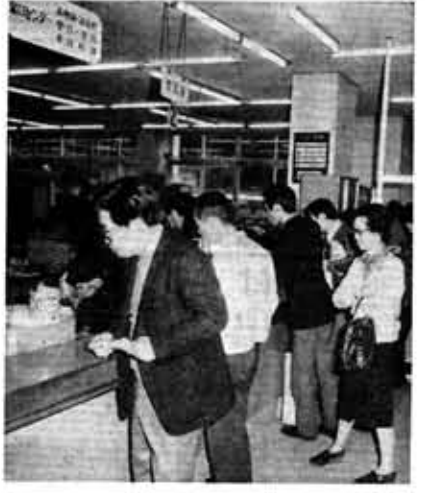
混雑する市民課窓口・3月19日（土）撮影

各種届・証明書を取扱っている市民課の窓口は、月曜日と土曜日に事務が集中し、非常に混雑します。 しかし、火曜日から金曜日までは比較的すいています。お急ぎでない方は、この日を利用していただくことも、要件も早く済み便利です。