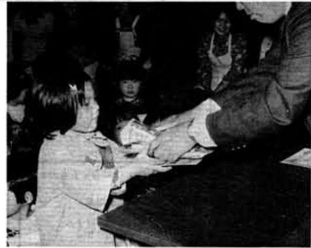
修了証とごほうびをもらい思わずニコリの良い子

交通安全の危険から身を、東、森本、向陽幼稚園に結守ろうと、北永田、鶏冠井、成され活動していた各サーフテイククラブは、三月にその修了式を行いました。このクラブは発足以来、毎月一回約一時間の年十二回（幼稚園は三回）の集いの中で、各回ごとにテーマを決め、交通ルールを学習してきました。