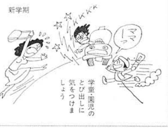
新学期 学童・園児の とび出しに 気をつけま しょう