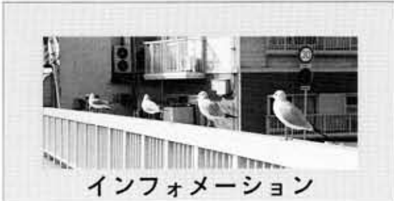
インフォメーション