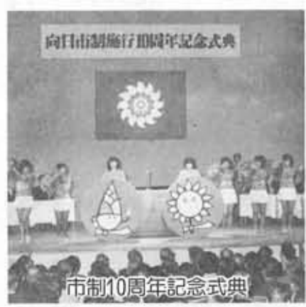
市制10周年記念式典

9・1 放置自転車条例スタート 保健センター、市庁舎増築工事起工式 7 森本公民館起工式 10・3 市制施行10周年記念式典、市の紋章マスコットマークシンボルカラーの