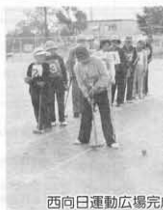
西向日運動広場完成

市では、国民健康保険に加入されている35歳以上の人を対象に、外来人間ドック(平日)の助成制度を実施しています。 申込み・お問い合わせ 福祉課国民医療係 内線229 来年1月から 高額療養費の 自己負担額が引き上げ 現在、お年寄りの医療は医療保険制度による保険給付と老人福祉法による老人医療費支給制度で行われていますが、来年2月1日から「老人保健法」により行われます。 新しい老人保健制度では医療保険(社会保険、健康保険など)に加入されている70歳以上の方がすべて対象となります。 現行の老人医療費受給者(寿)は、2月1日以後使えなくなりました。また、新しく老人保健の対象となる方で、現在老人医療受給証をお持ちでない方は、現在加入されている医療保険証を福祉課までお届けください。 来年1月1日から、この自己負担分の限度額が5万1000円に引き上げられます。ただし、市税非課税世帯は、3万9000円に引き上げられます。 受診費用 (1)男性1万8000円(2)女性1万7000円 主婦ドック6600円 なお、この受診費用は、経費用の3割分となっております。残り7割は市が負担しています。