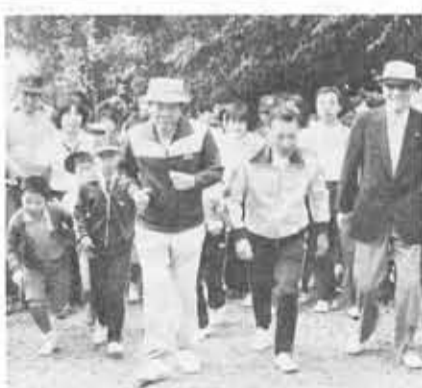
市民スポーツカーニバル

9・1 放置自転車条例スタート 保健センター、市庁舎増築工事起工式 7 森本公民館起工式 10・3 市制施行10周年記念式典、市の紋章マスコットマークシンボルカラーの