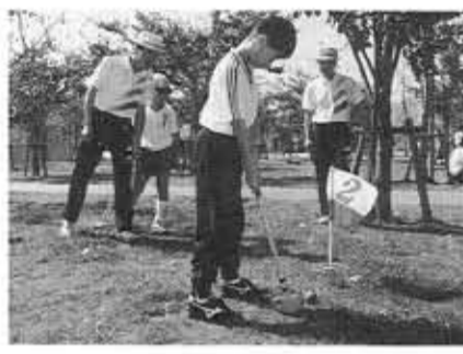
対象は向日市民、講師は向日市体育指導委員。申込み・お問い合わせは6月24日(金)までに教育委員会スポーツ振興課(内線351)へ。

日時：6月25日〜7月30日の毎土曜日、午後6時30分〜8時30分(全6回)。募集対象は市内在住の18歳以上の経験者。参加費は7000円。