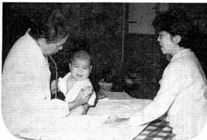
子どもからお年寄りまで市民の健康を守る