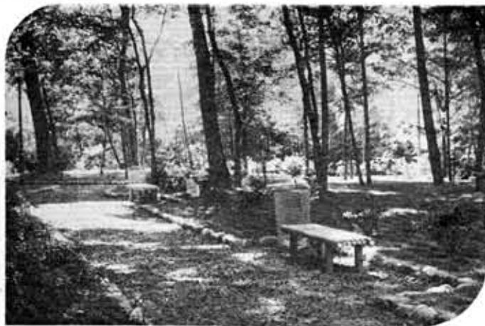
やすらぎの場として勝山緑地オープン