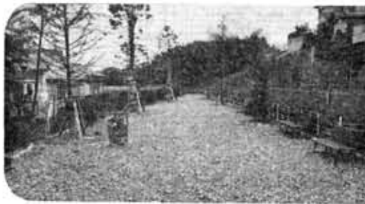
いこいの場として北ノ口緑地オープン