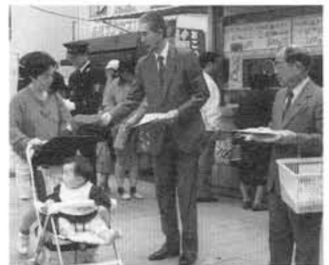
■春の防犯運動街頭啓発■ニチイ向日町店前で、空き巣ねらいや自動車盗への注意を呼びかけました。

「向日町の誕生」を探る 1992年。来年は、向日市にとって、大変意義の深い年です。市制施行20周年、そして、市の前身、「向日町」(厳密には、向日町新町)という町名が、歴史に初めて登場してから400年になります。天正20年(1592年)、向日神社の門前、西国街道沿いには、両側に商人や職人が軒をつらね、大層にぎわっていました。江戸時代から明治、大正、昭和にかけて、乙訓の商業や政治・文化の中心として発展してきました。地域に残された古文書や記録をもとに、向日町の誕生を4回シリーズで探ります。5月19日「向日町の誕生」7月21日「向日町の生活」11月17日「向日町を歩こう」12月8日「向日町の復興」時間は、午後2時～4時、文化資料館