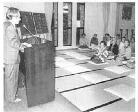
■家族介護者教室■「痴呆について」がテーマの今回の教室は、参加者も真剣に聴講しました。