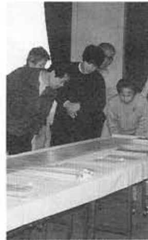
古文書の研究も楽しみます

文化資料館 日曜談話会 「向日町の誕生」を探る 1992年。来年は、向日市にとって、大変意義の深い年です。市制施行20周年、そして、市の前身、「向日町」(厳密には、向日町新町)という町名が、歴史に初めて登場してから400年になります。天正20年(1592年)、向日神社の門前、西国街道沿いには、両側に商人や職人が軒をつらね、大層にぎわっていました。江戸時代から明治、大正、昭和にかけて、乙訓の商業や政治・文化の中心として発展してきました。地域に残された古文書や記録をもとに、向日町の誕生を4回シリーズで探ります。5月19日「向日町の誕生」7月21日「向日町の生活」11月17日「向日町を歩こう」12月8日「向日町の復興」時間は、午後2時～4時、文化資料館