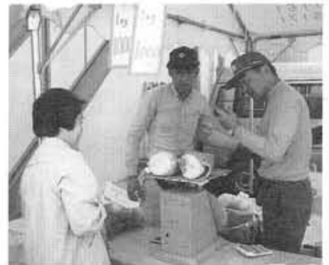
■朝掘りたけのこ直売会■旬の味を求める人たちに、用意されたたけのこはたちまち売り切れです。