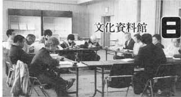
熱心なファンもいる日曜談話会

文化資料館 日曜談話会 「向日町の誕生」を探る 1992年。来年は、向日市にとって、大変意義の深い年です。市制施行20周年、そして、市の前身、「向日町」(厳密には、向日町新町)という町名が、歴史に初めて登場してから400年になります。天正20年(1592年)、向日神社の門前、西国街道沿いには、両側に商人や職人が軒をつらね、大層にぎわっていました。江戸時代から明治、大正、昭和にかけて、乙訓の商業や政治・文化の中心として発展してきました。地域に残された古文書や記録をもとに、向日町の誕生を4回シリーズで探ります。5月19日「向日町の誕生」7月21日「向日町の生活」11月17日「向日町を歩こう」12月8日「向日町の復興」時間は、午後2時～4時、文化資料館