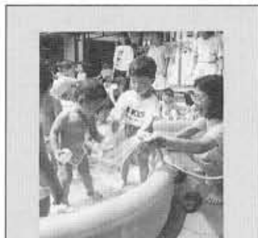
インフォメーション

軽スポーツフェア 8月7日(日)午後6時30分～9時、第3向陽小学校で。ソフトバレー・インディアアカ・グラウンドゴルフ・ベタンクなど年齢に関係なく気軽に楽しむことができます。 ▽お問い合わせは教育委員会スポーツ振興課(内線351)へ。 保育所保母 アルバイト保母募集 勤務は、8月18日、8月27日(約4ヵ月間。午前8時30分～午後5時(時差勤務有))