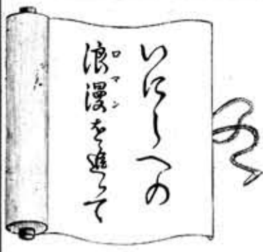
市史編さん活動日誌から②③

古くなった地図などというものは、古い電話帳や時刻表と同様、実際の役には立たないが、できてから年月が経つと、歴史的な資料として重要性が出てくる。わが国で正確な科学的地図が作られるようになったのは、明治に入ってからで、関東と関西で別々に二万分の一地形図が作成された。