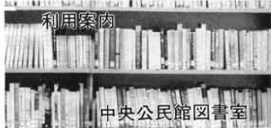
中央公民館図書室

物集女公民館の「春の学習発表会」 この学習成果を見てくださいます。物集女公民館恒例の「春の学習発表会」が先月19日・20日の2日間、同公民館で開かれました。 会場には、この一年間学習した各教室の苦心作が約20点、ところ狭しと展示され、訪れた市民の方にも、友人はだしの作品に、しばし足をとめて見入っていました。