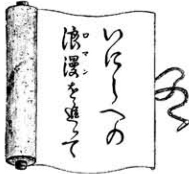
市史編さん活動日誌から⑤③

7月の行事予定 老人福祉センター ▽休館日 1日(日)・9日(月)・15日(日)・23日(月)・29日(日) ▽血圧測定 5日(木)・19日(木) ▽独居老人昼食会 6日(金)・20日(金) ▽老人サークルクラブ 6日(金) 午後2時～3時 ▽高齢者職業相談 10日(火) 午前10時～午後4時 ▽健康相談 13日(金)・27日(金) ▽午後2時～午後3時30分 ▽演劇同好会発表会 30日(月) 午後1時～2時30分 ▽清掃日 5日(木) 午前10時～11時