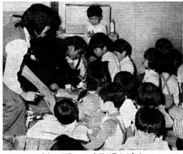
楽しく交通ルールを学ぶ子どもたち

続いて、婦交さんの指導のもと、子どもは、はめ絵でお遊び、お母さんは、子どもの交通事故を防止するうえでの注意点をききました。