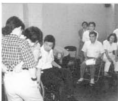
▲市民ボランティア講座▲実技を通して「正しい車椅子の扱い方」「車椅子介助の実際を」体験。