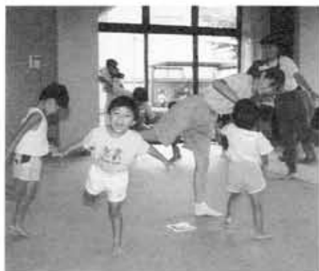
▲親子で楽しむリズム体操▲子どもといっしょに跳んだりねたり踊ったり。子育ては、ふれあいです。