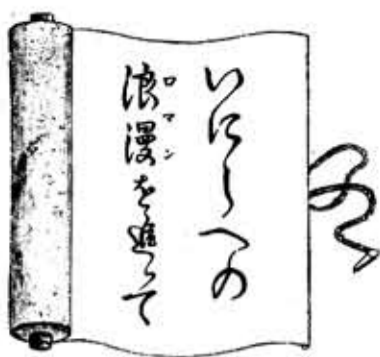
市史編さん活動日誌から(59)

現在の向日市は、その住民の大部分が転入者で戦前からの居住者は一〇%余りしかない。その職業も大部分がサラリーマンで、今では向日市は典型的な近郊住宅都市になっている。しかし、戦前までは、向日神社の鳥居前の西園街道沿いに商店の並ぶ「町」があったのは、市域の大部分が田圃地帯であった。そこでは水田の耕作をはじめ、